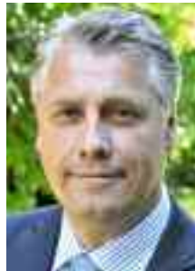
Friedrich Hubert Esser, Präsident des Bundesinstituts für Berufsbildung (BIBB).

Es müssen alle Potenziale erschlossen werden. Dies gilt für Abiturienten, die bisher im Handwerk mit einem relativ geringen Anteil vertreten sind. Für sie muss das Handwerk stärker als bisher Karriereperspektiven vermitteln und in die Ausbildung attraktive Zusatzangebote integrieren. Jugendliche mit weniger gutem Schulerfolg brauchen eine besondere Unterstützung. Hier hat das Handwerk in der Vergangenheit bewiesen, dass aus diesen Jugendlichen trotzdem gute Gesellen werden können.